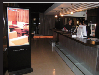
カウンター前の案内で客単価アップ

●液晶パネルは非常に精密度の高い技術で作られておりますが、ドット抜けや常時点灯するドットがありますのでご了承ください。●画面ははめ込み合成です。●ご購入の際は必ず「保証書」の記載事項確認の上、大切に保管してください。●カタログと実際の商品の色とは、印刷の関係で多少異なることがあります。●商品には故意にぶつからないでください。●正しく安全にお使いいただくために、ご使用前には必ず「取扱説明書」をお読みの上、正しくお使いください。●詳しくはお問合わせ下さい。