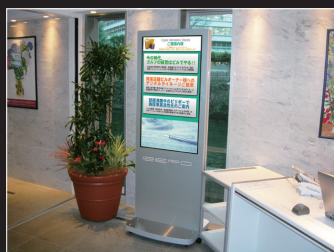
ロビーの案内板としてお客様を誘導