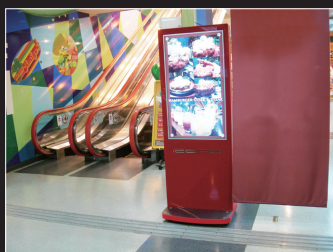
エレベーター前などで商品をアピール